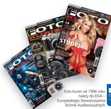
Foto-Kurier od 1996 roku należy do EISA – Europejskiego Stowarzyszenia Techniki Audiovizualnych