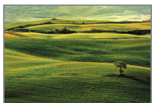
„Iskonia zamierzona w zielony” for S. Pińdora