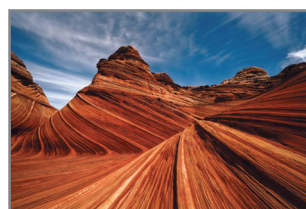
„Wave – Arizona” for S. Pińdora