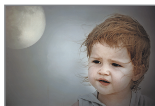
„W kąt przegry, jasną noc...” for E. Ochodek