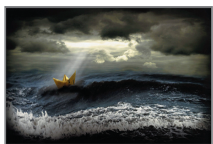
„Nadzieja” for G. Dudek

Redakcja: ul. Rzędzińska 23, 01-368 Warszawa, tel.: 22-665-40-98, redakcja@foto-kurier.pl, prenumerata@foto-kurier.pl