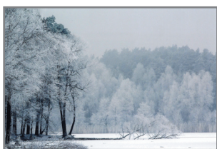
„Piękniejsza siołeczka zimą” for J. Sommer